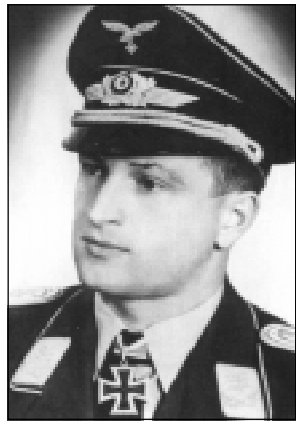
Командир II./JG51 гауптман Йозеф Фёзе (Josef Fözö). Награждён RK 02.07.41г. Всего на его счету 27 побед.