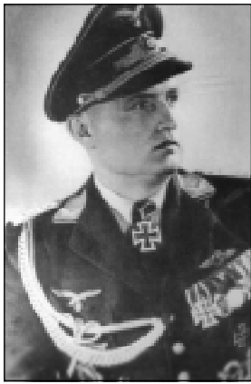
Обер-лейтенант Герберт Шоб (Herbert Schob). Награждён RK 09.06.44г. Всего на его счету 28 побед.